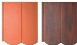
lávová červená antik